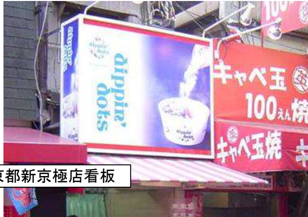
京都新京極店看板