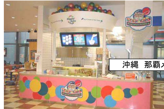
沖縄 那覇メインプレイス店

あくまでもイメージですので、 この通りのショップ作りを指定しては ありません。 但し、最低限のロゴの表示は お願いします。 具体的に出店をご検討される 際には、打合せの場を持たせて 頂きます。