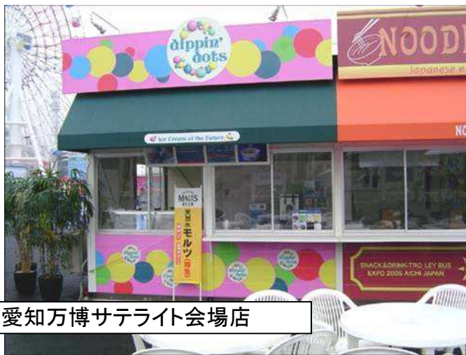
愛知万博サテライト会場店

沖縄の店舗程度の造作で、腰 下と頭上のコルトン(メニュー ボード)程度であれば、 さほど、コストは掛からない と思います。