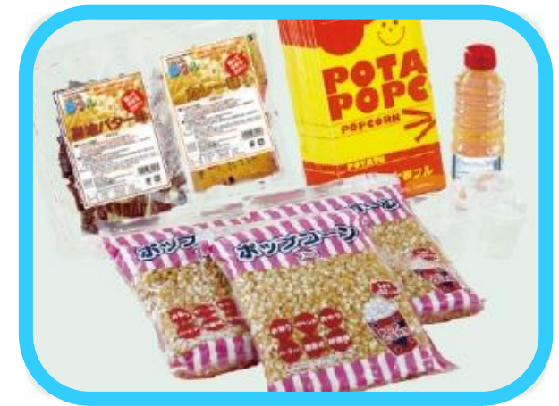
ポップコーン夢フルセット