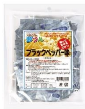
ブラックペッパー