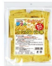
コーンポタージュ