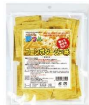
コーンポタージュ