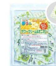
サワークリーム& 5 オニオン