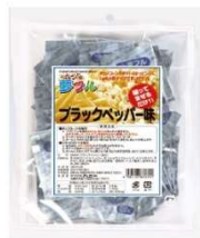
ブラックペッパー