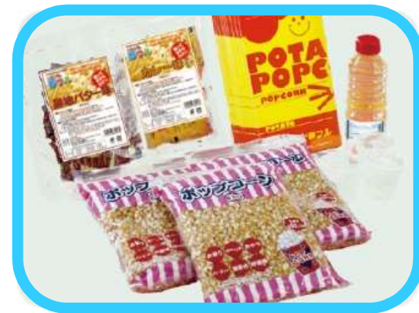
ポップコーン夢フルセット